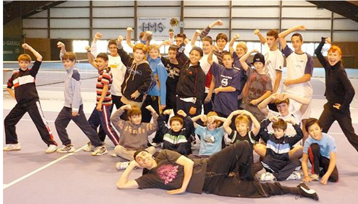
Le sport dans la joie: les participants de Men on Ice et leurs profs de danse après la leçon de Hip-Hop!

La compétition USP Men on Ice 2010 s'est déroulée le 3 janvier sur la patinoire de Oberwytental à Reinach/AG.