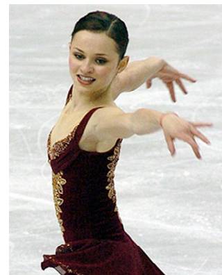
Sasha Cohen.